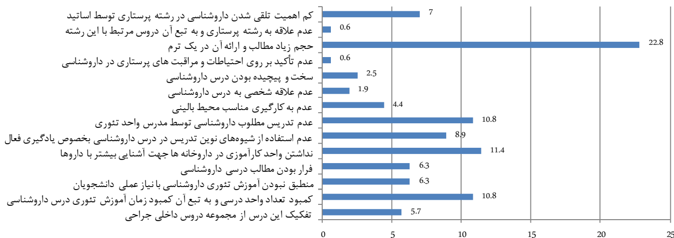
نمودار شماره ۲): توزیع فراوانی پاسخ دانشجویان نسبت به اولویت بندی انتخاب راهکار مناسب جهت رفع ضعف در داروشناسی

کافیست (۱۰). هیدی گراندل در مطالعه خود بیان می‌دارد که فقط حدود ۱۸ درصد از دانشجویان از دانش داروشناسی خود رضایت دارند (۷).