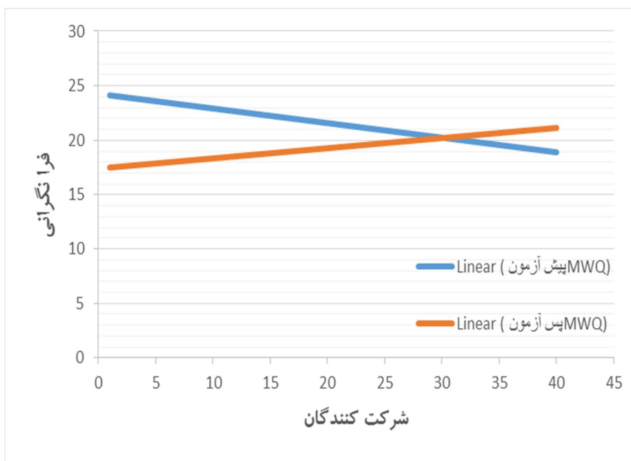
نمودار (۳): نمره‌های فرانگرانی (MWQ) دو گروه در پیش‌آزمون و پس‌آزمون

فراشناختی را بر روی نگرانی‌ها و اختلال اضطراب فراگیر (۱۷، ۲۷، ۲۸)، اضطراب، افسردگی، بدکارکردی‌های فراشناختی (۱۲، ۱۶، ۲۹)، اختلال استرس پس از سانحه (۳۰)، اختلالات خلقی (۱۳)، اضطراب بارداری (۳۱) نشان داده‌اند که همسو با نتایج پژوهش حاضر می‌باشد.