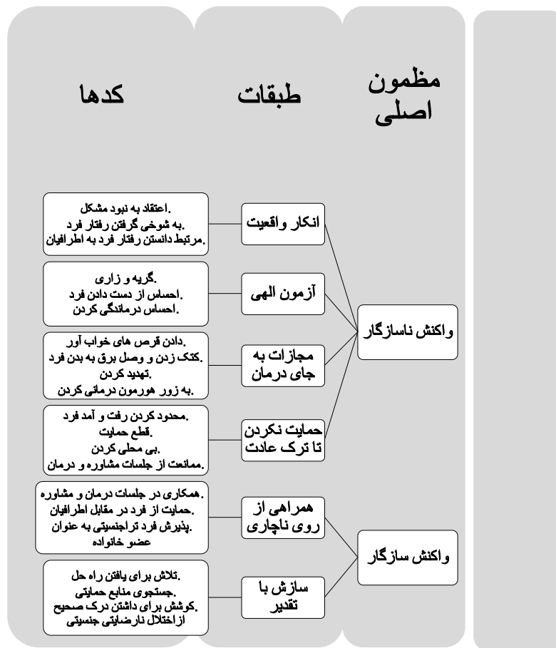
شکل (۱): مفاهیم و مقوله‌های استخراج شده از تحلیل کیفی داده‌ها