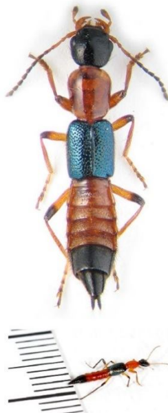
تصویر (۱): پدروس فوسپیس، گونه غالب در استان‌های شمالی کشور

و اپیدرمولیز خود التیام یابنده می‌شود که به آن درماتیت پدروس می‌گوی‌ند (۶,۷).